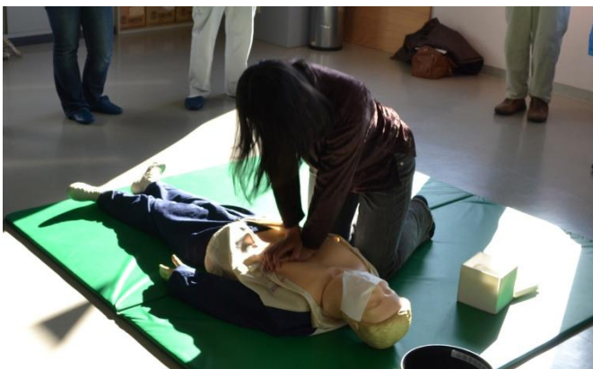
心肺蘇生法の実技風景