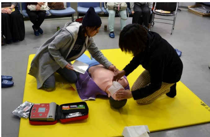
AEDを使った心肺蘇生法の実技

スポーツジムでインストラクター をしている方々が みなさん熱心に受 講されました。