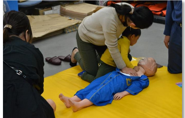
お母さんと一緒に胸骨圧迫！