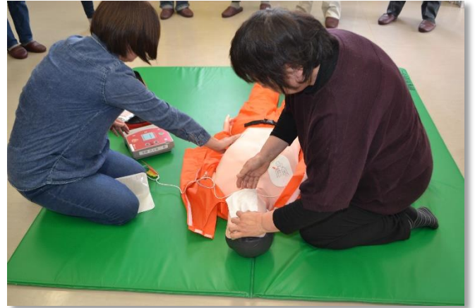
AEDを使った心肺蘇生法の実技