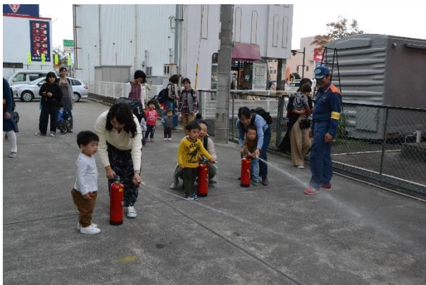
水消火器を使った消火訓練