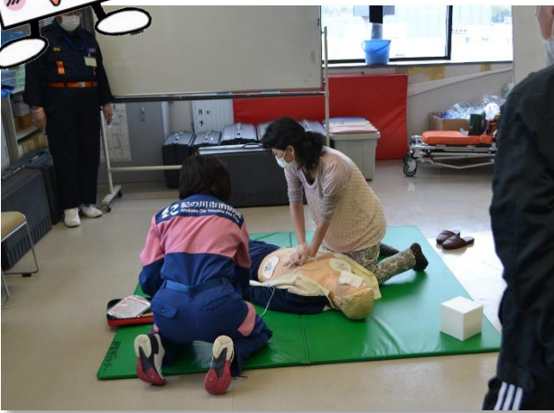
AEDを使った心肺蘇生の実技