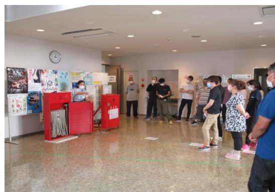
講習会に伴う訓練状況（消防用設備の解説）