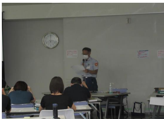
講習会に伴う訓練状況（煙体験）