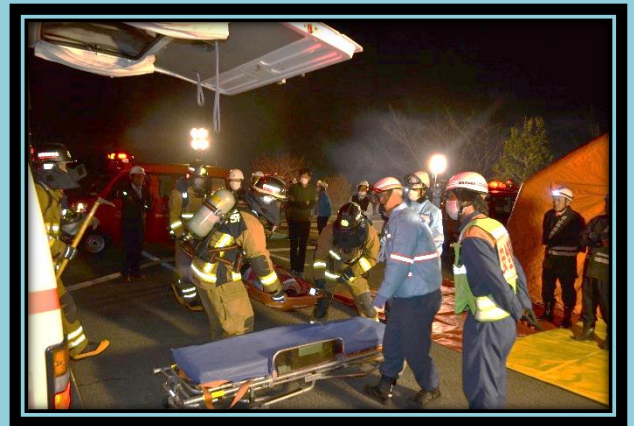
トリアージした傷病者を救急車へ収容する救急隊と消防隊。