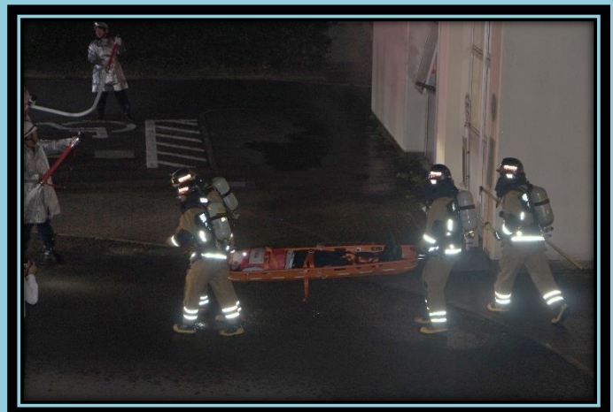
逃げ遅れ者の救出