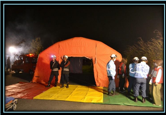
応急救護所 (エアートtent)