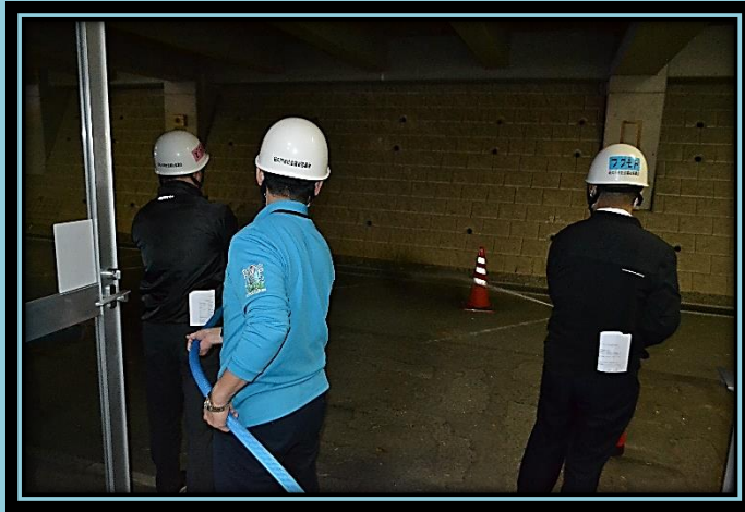
自衛消防隊による初期消火