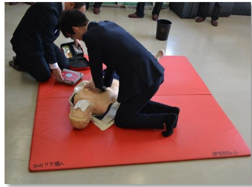
AEDを使った心肺蘇生法の実技