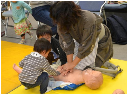
お母さんと一緒に胸骨圧迫！