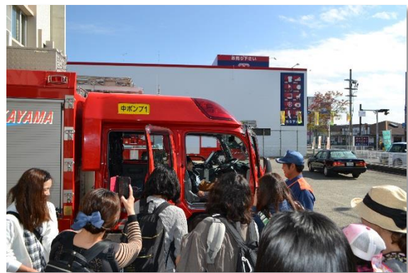
消防車両乗車体験